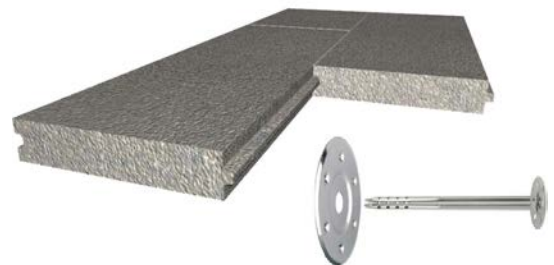
Dübelschema zur nachträglichen Befestigung